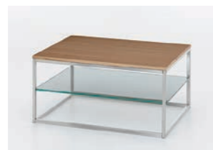
GESTELL EDELSTAHL Tischplatte Kernbuche furniert, Ablageboden Klarglas, B/H/T ca. 90/44/70 cm