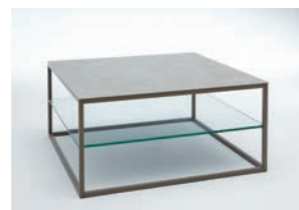
GESTELL TAUPE Tischplatte Keramik Beton, Ablageboden Klarglas B/H/T ca. 90/44/70 cm