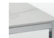
PLATTE KERAMIK CALACATTA Gestell Chrom