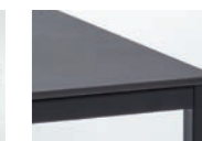
PLATTE KERAMIK BASALT BLACK Gestell Lack Schwarz