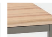
PLATTE KERNBUCHE furniert, Gestell Lack Taupe