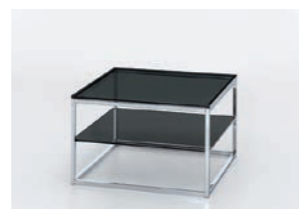
GESTELL CHROM Tischplatte und Ablageboden Rauchglas B/H/T ca. 70/44/70 cm