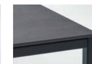
PLATTE KERAMIK IRON GREY Gestell Lack Schwarz