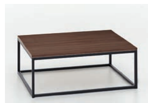
GESTELL SCHWARZ Tischplatte Nussbaum furniert B/H/T ca. 110/34/70 cm