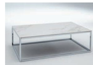
GESTELL CHROM Tischplatte Keramik Calacatta B/H/T ca. 90/34/70 cm