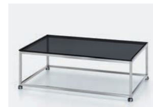
GESTELL EDELSTAHL MIT DOPPELROLLEN Tischplatte Rauchglas B/H/T ca. 110/34/70 cm