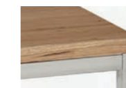
PLATTE ASTEICHE furniert, Gestell Edelstahl

Ausgesuchte Materialien in bester handwerklicher Verarbeitung.