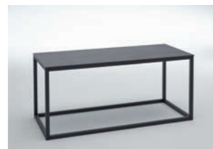
GESTELL SCHWARZ Tischplatte Keramik Iron Grey B/H/T ca. 90/44/40 cm