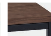
PLATTE NUSSBAUM furniert, Gestell Lack Schwarz