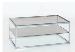
GESTELL CHROM Tischplatte und Ablageboden Klarglas B/H/T ca. 110/44/70 cm